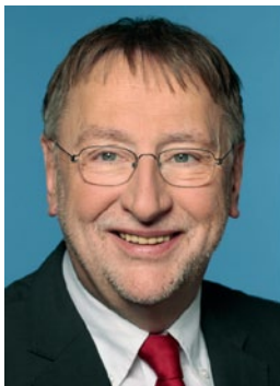
Bernd Lange, MdEP (SPD)

Meine Kollegen und ich haben diese Punkte in einer Resolution des Europäischen Parlamentes vom 4. Juli 2013 zu einem zukünftigen TiSA abrufbar unter http://www.europarl.europa.eu/sides/getDoc.do?pubRef=-//EP//TEXT+TA+P7-TA-2013-0325+0+DOC+XML+V0//DE zur Voraussetzung unserer notwendigen Zustimmung zu einem Verhandlungsergebnis gemacht. [...]